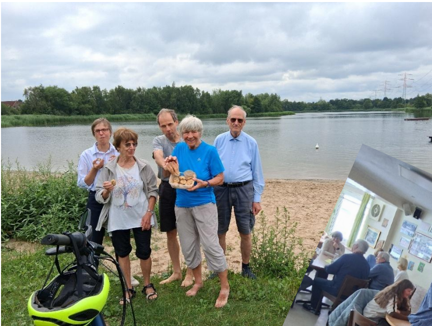
30 Jahre Clubhaus